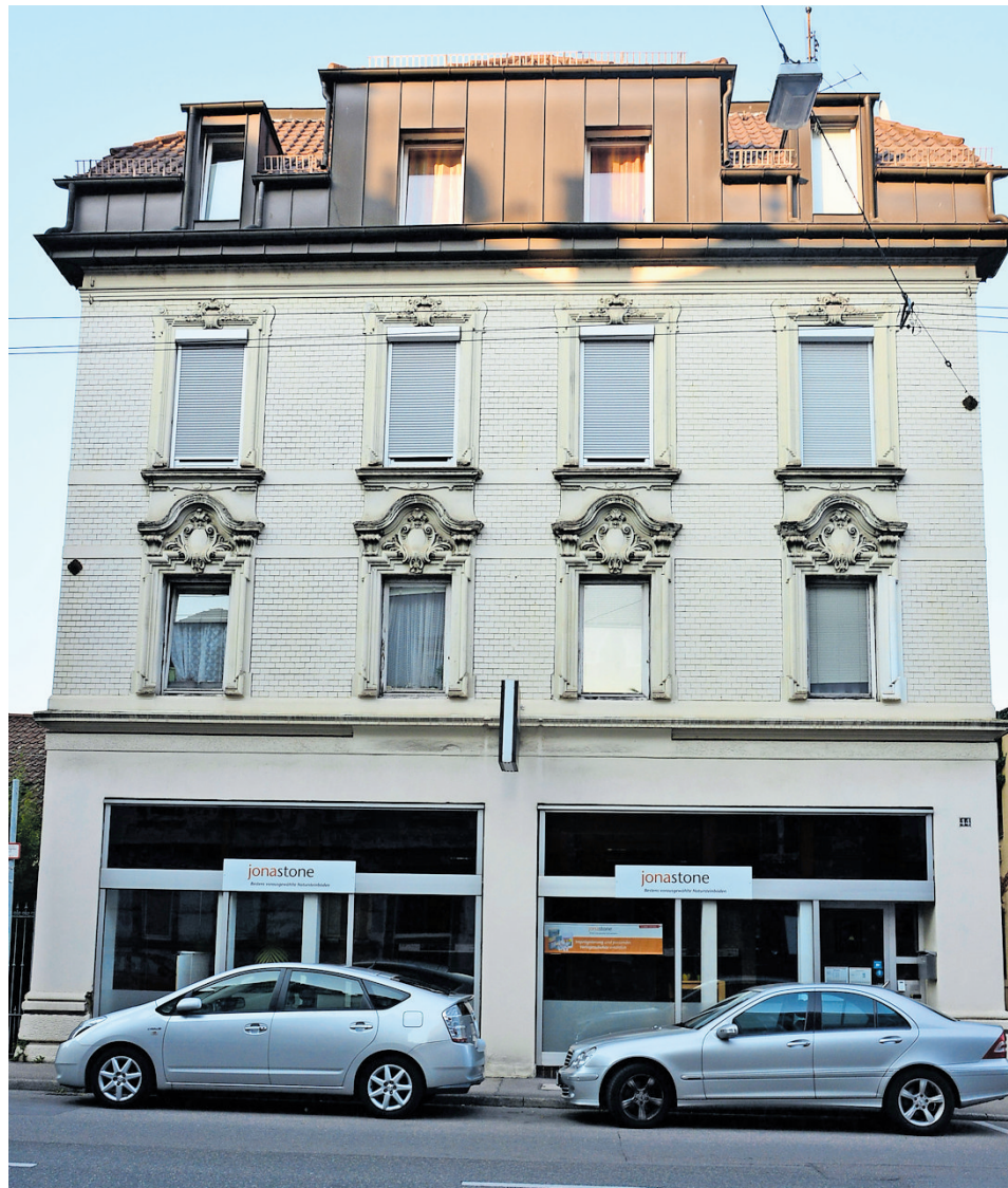
In diesem Haus in der Brückenstraße wohnte einst die Familie des Physikers und Nobelpreisträgers Albert Einstein.